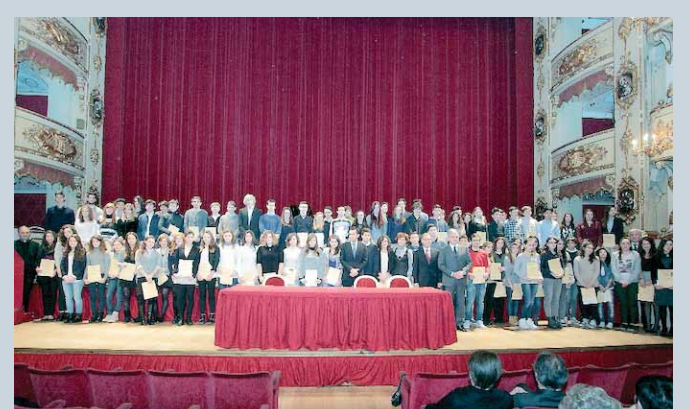
I premiati del 2013